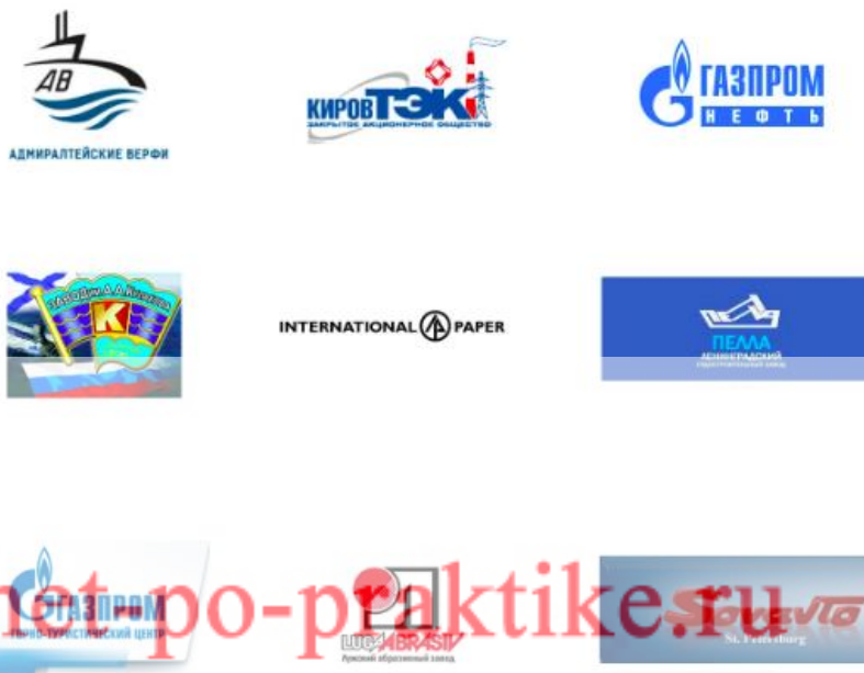
Рисунок 1 - Клиенты ООО ПК «ВентКомплекс»

Клиенты ООО ПК «ВентКомплекс» приведены на рисунке 2.